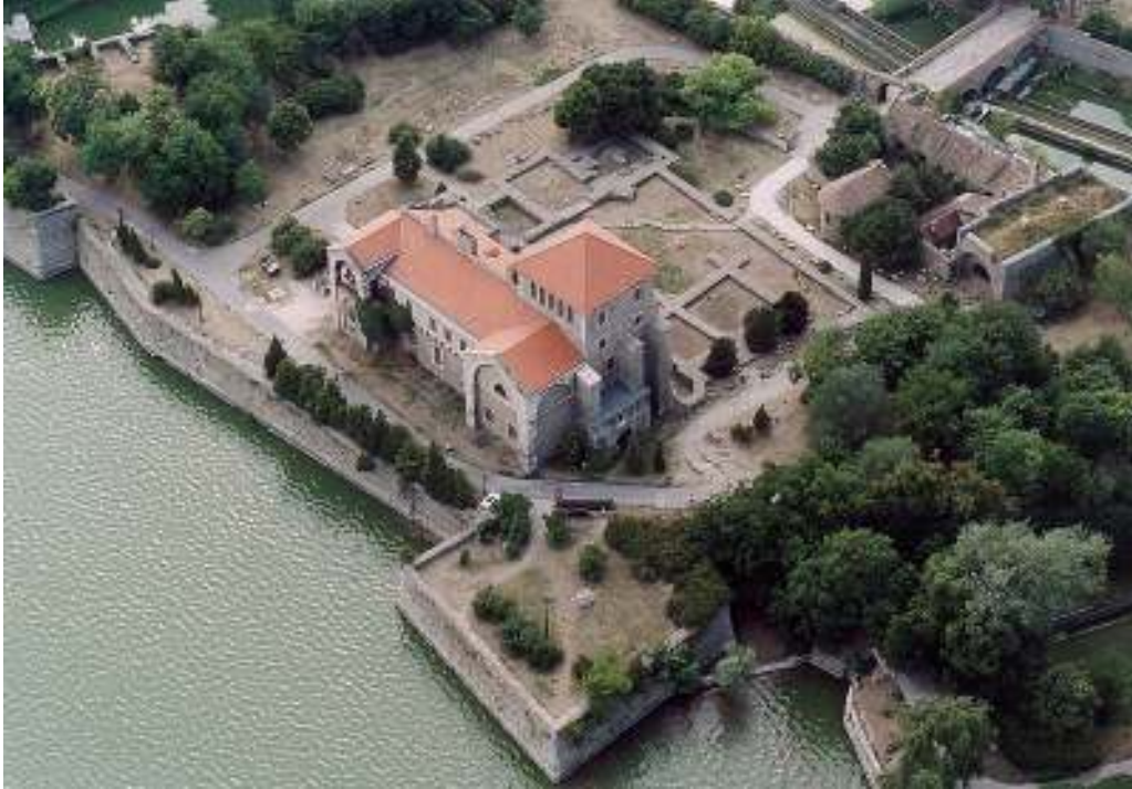
タタの城とオレグ湖