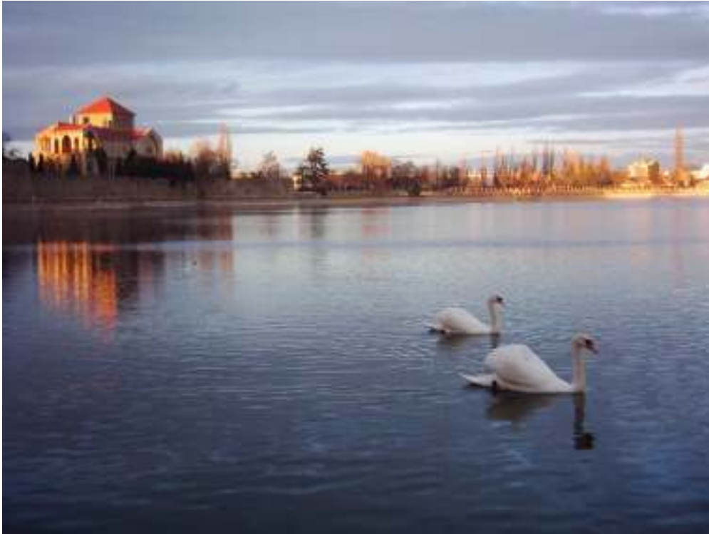
オレグ (Öreg) 湖

イギリス公園 (Angolpark) にも小さい城もあります。イギリス公園で最も古い建物です。元々、夏の住居として建てさせたものです。