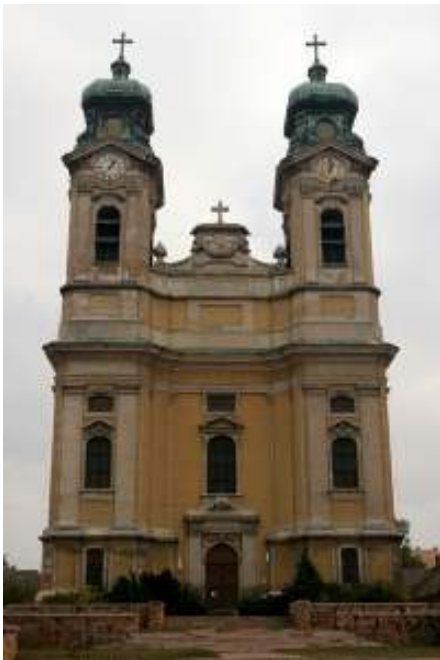
タタの教会の一つ（Szent Kereszt 教会）

タタにはいろいろな 教会 があります。たとえば、Evangélikus 教会とか Kapucinus 教会とか Református 教会とか Szent Kereszt 教会などです。