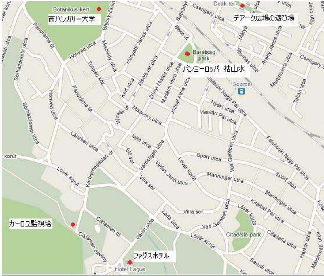
南ショプロンの地図