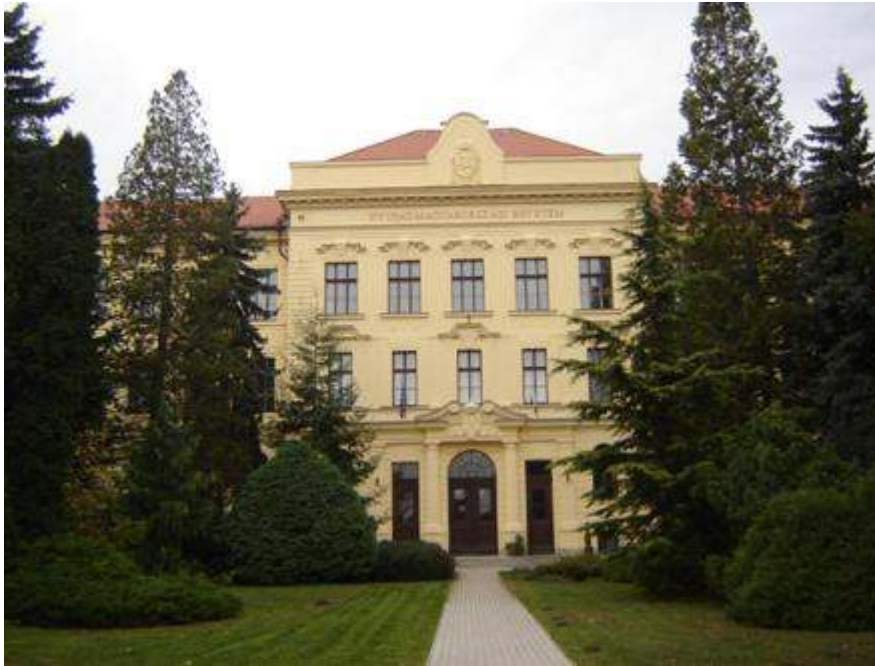
林学部のキャンパス

同大学の中心がショプロンにある。1918年に大学はスロバキアのバンスカー・シュチヤヴニツァ-BANSKA STIAVNICA（ハンガリー語でセルメツバーニャ-SELMECBÁNIA）からショプロンに引越した。今ショプロンにある学部は経済学部、林学部と木材科学部である。