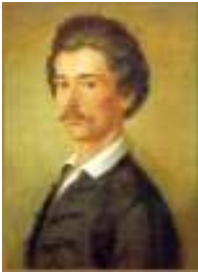
ペテーフィ・シャーンドル — Petofi Sandor