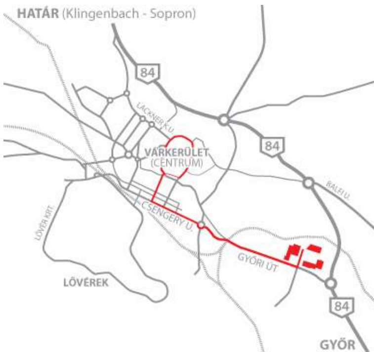
チェンズキングの図