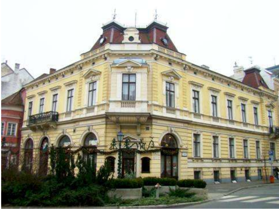
ドモトリ喫茶店 DÖMÖTÖRI CUKRÁSZDA