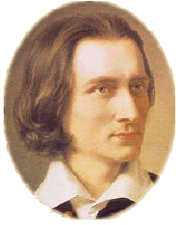
リスト・フェレンツ — Liszt Ferenc