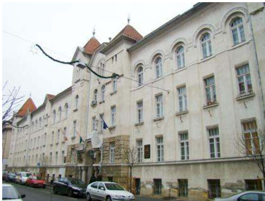
経済学部のキャンパス