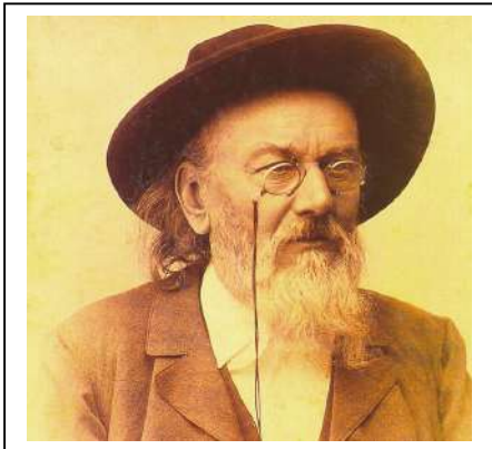
ジオルナイ・ヴェルモシュ(Zsolnay Vilmos)

ジオルナイ・ヴェルモシュはジオルナイという有名な陶磁器メーカーの創立者であった。