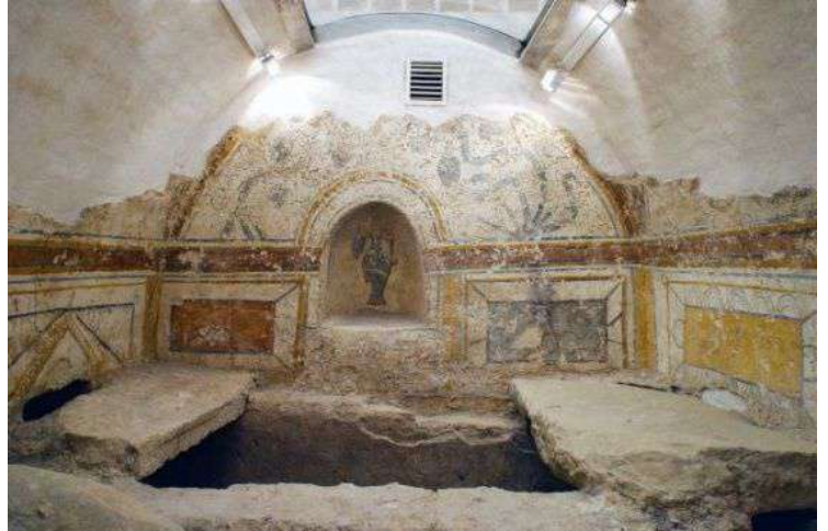
ペーチの初期キリスト教墓所

ペーチはとても歴史的な町である。したがって、2010年度の欧州文化首都に選ばれてきた。神聖ローマ帝国の時この地域はソピアナエと呼ばれており、あの時代の用水路などの遺跡が現在にも見られる。それで、オスマン帝国はハンガリーを占領した時からも寺院や絨毯などの遺跡が多く残っている。ペーチのモスクはハンガリーで類のない寺院になっている。