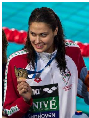
ヤカボシュ・ジュジャンナ (Jakabos Zsuzsanna)

ケンデレシ・タマーシュはペーチで学校に行ったハンガリーを代表するスイマーである。まだ22歳ながら、2018年までオリンピックや全国選手権やヨーロッパ水泳選手権に全部で13枚のメダルをもらった。20歳の時2016年のオリンピックの200メートルバタフライ準決勝に世界有名水泳選手のマイケル・フェルプスにも打ち勝った。