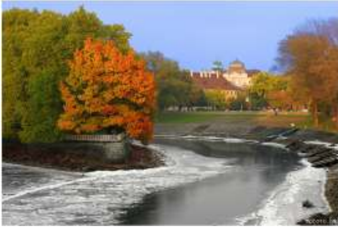
Raba 川と Rado 公園