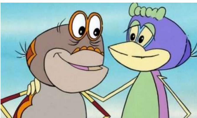
「ビジポーク・チョダポーク」 Vízipók-Csodapók