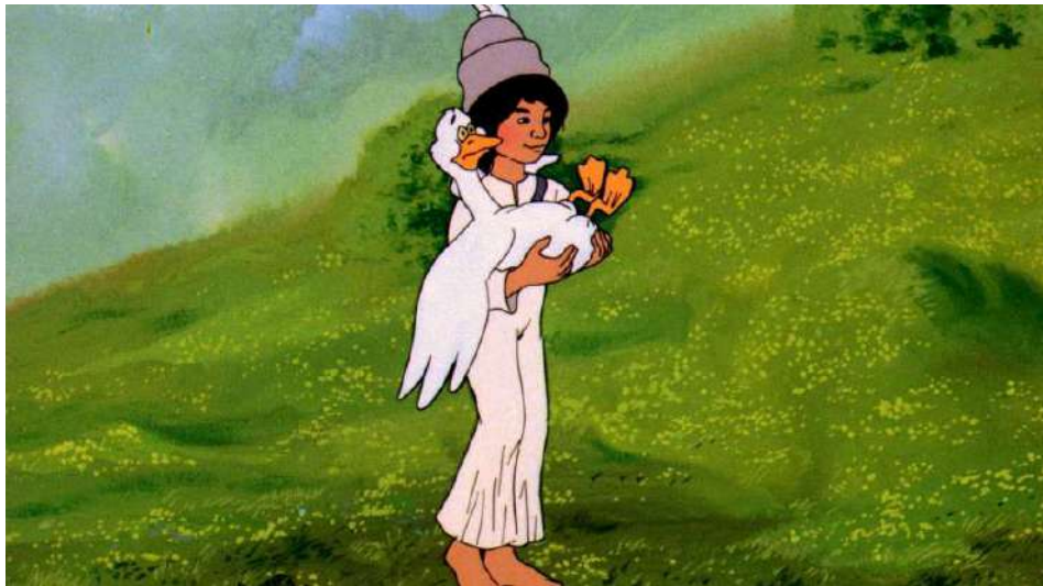
「ルダシュ・マチ」 Ludas Matyi