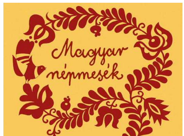
「ハンガリーの民間説話」 Magyar népmesék