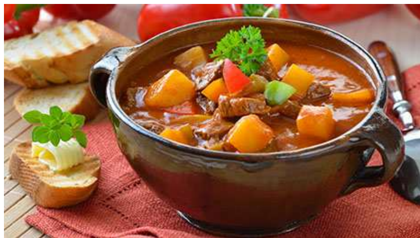
グラージュ・スープ (Gulyás leves)