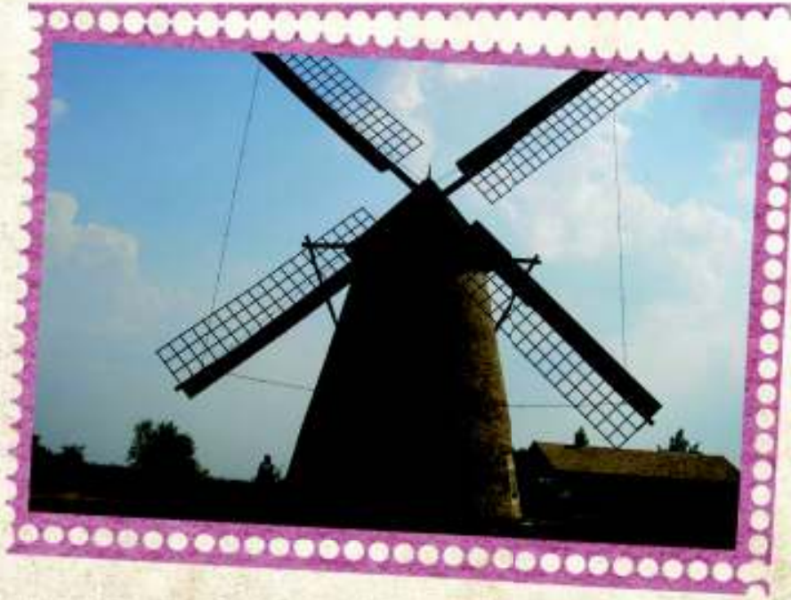
※シュカンゼン (Skanzen)の風車

2009年にヨーロッパの一番長い鉄道がここに建てられました。乗客たちを更改した1930年の Ganz-Jendrassik 電車が運びます。電車スタッフのメンバーも当時の服を着ています。