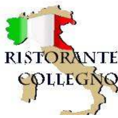
レストランテコレニョ

レストランが一番良いです。ハンガリー料理なら隣のセープハロム村(シャートルアルヤウーイヘイの区)にあるムーゼウムケルトレストランをお勧めします。