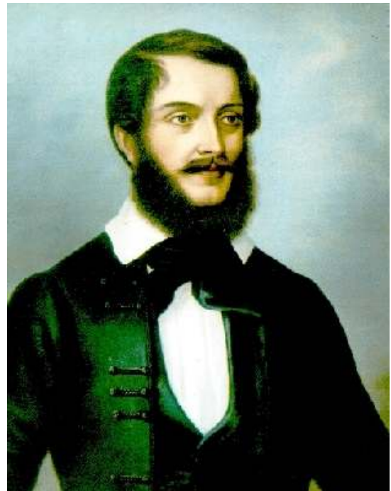
コシュート・ラヨシュ