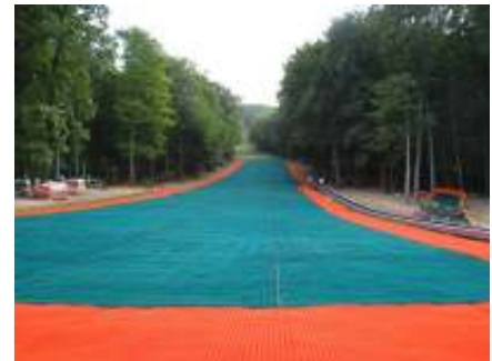
スキーの人工スロープ

プのおかげで年間いつでもできるようになっています。スロープを使うこととスキーの服を借りることにすれば大体5000フォリントを払わなければなりません。ハンガリーの一番長い夏ボブもこのパークにあって、500フォリントで滑れます。またはドーナッツようなタビーもやってみられます。それは小さい子供の一番人気があるアトラクションです。200フォリントで使えます。そして今流行っているアドベンチャーコースもあります。3-6メートルの地上で木から木まで色々な障害物を乗り越えていきます。最後の障害物は長いスライドでそこまでできた人は解放的なスライダーに乗ることができます。アドベンチャーコースは3つもあります。子供に緑のコース、大人は赤、プロに黒いコースが一番良いです。コースによって700フォリントから1500フォリントです。