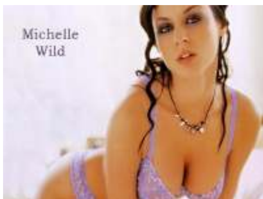
ポルノ女優のミシェル・ワイルド

のに(IQは150以上といわれています)、ストリップショーで働いて、エロチックテレフォンの仕事もしました。最初のポルノ映画は2000年のセックスオペラでした。その後たく