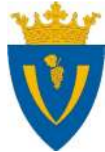
シャートルアルヤウーイヘイの紋章

シャートルアルヤウーイヘイはハンガリーの北東のボルショド・アバウイ・ゼンプレーン県にある小さい町です。人口は大体15900人で町のエリアは73,44平方キロメートルです。シャートルアルヤウーイヘイは国境にある町ですからスロバキアに数百歩で行けます。