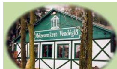
ムーゼウムケルトレストラン