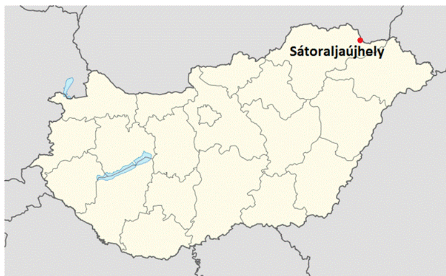
ハンガリーの東北にあるシャートルアルヤウーイヘイ