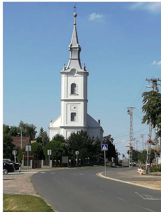
プロテスタント教会