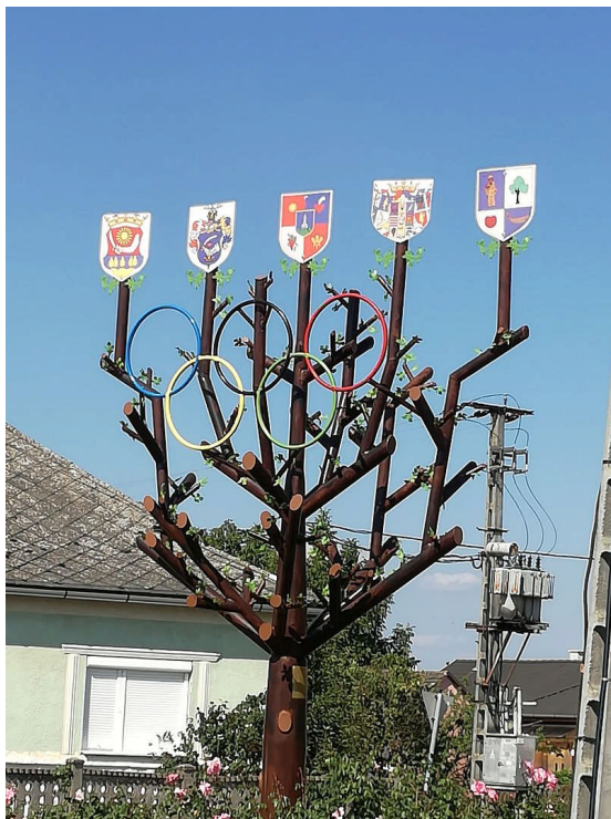
オリンピックツリー

パプには、青銅器時代から人が住んでいたといわれています。1272年にはテッラ司祭、1458年にはヴァールダ家が領主になりました。18世紀の終わりから19世紀のはじめには、エステルハージ家などが領主になりました。1800年に蒸気機関で動く工場、1821年には小学校ができ、1833年にはプロテスタント教会、1899年には蒸留所も建てられました。19世紀に入ると、町には151軒の家が建ち人口も827名となりました。第二次世界大戦では多くの人々が亡くなり、1993年にその人たちの記念碑が建てられました。現在はプロテスタント教会とかオリンピックツリーとかホルバート家宮殿など色々な観光スポットがあります。