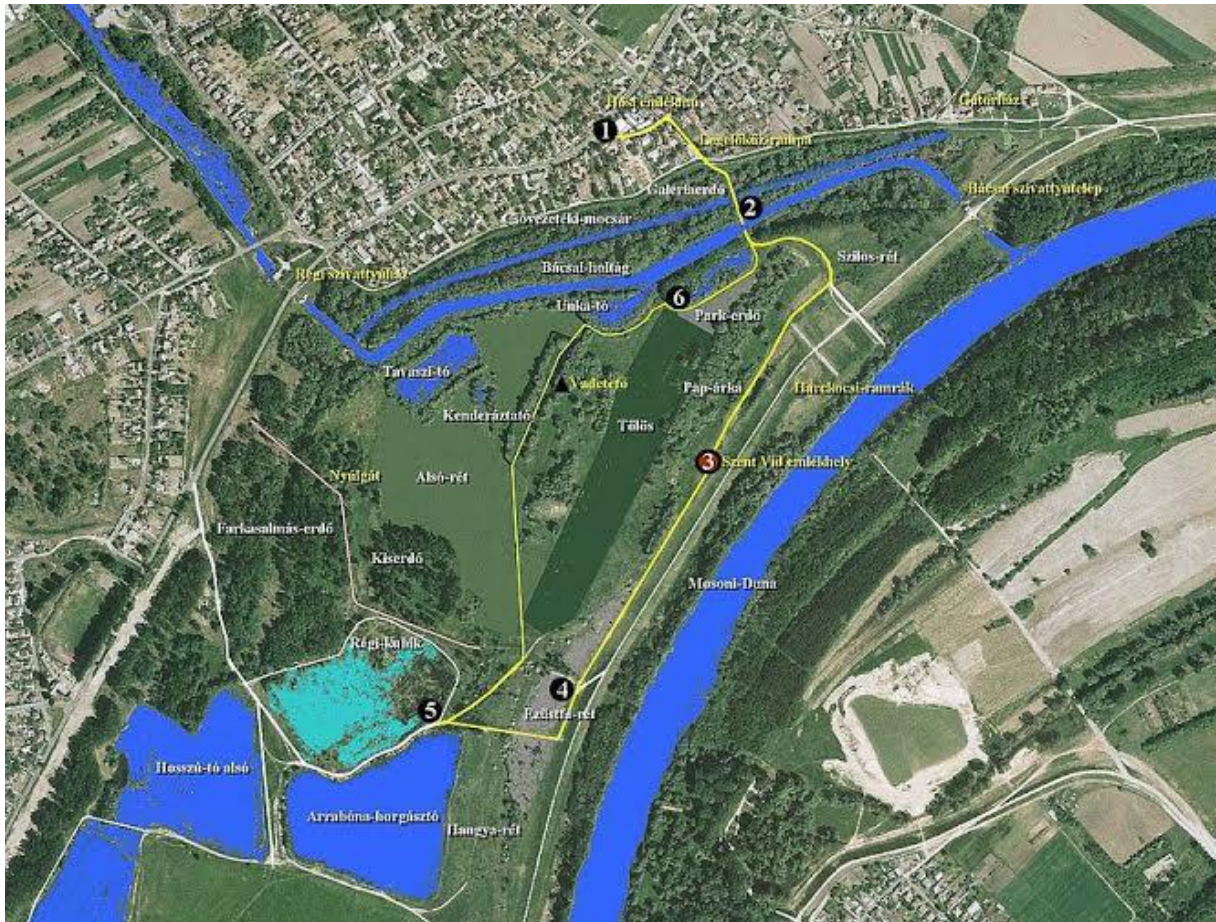
Сzent Vid のネイチャートレイルの地図

は地雷湖であったが、20世紀から魚の養殖が行われており、現在も魚の管理が行われている。また保護鳥が巣を作っているのでも有名である。バーチャの釣り協会の養魚池であるため釣り協会の会員だけが釣りをする事ができる。