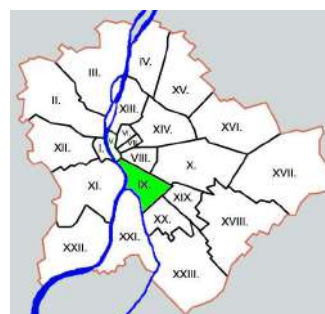
ブダペストの23つの行政区画 (フェレンツヴァーロシュは 緑色である)