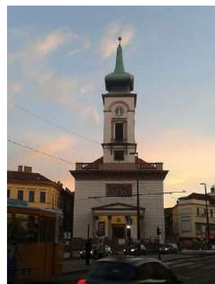
ブダペストのカルビン広場の改革派教会