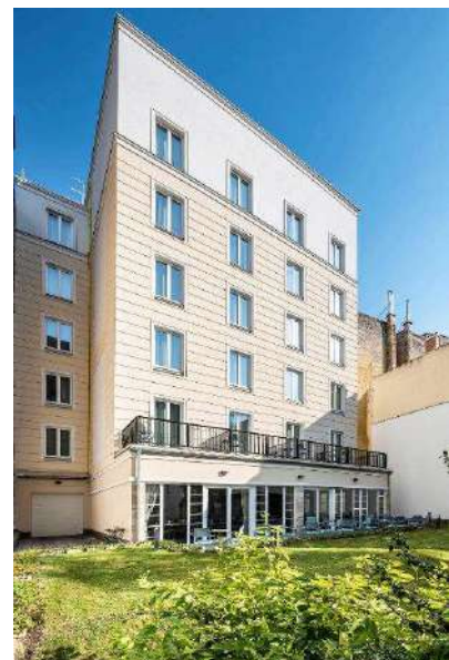
スリー・コーナーズ・ライフスタイル・ホテル

有名なラーダイ（Ráday）通りは、快適なテラスとレストランでお客様をお待ちしており、ホテルから100メートルにある。ハン