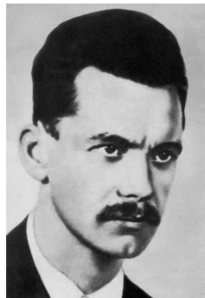
ヨーゼフ・アティラ (1905年—1937年)

ヨーゼフ・アティラはハンガリーの20世紀の詩人で、韻文の天才的で感動的な様式で知られている、ハンガリーでは現在でも人気があり、愛好されている。ハンガリーの小学生・高校生でヨーゼフ・アティラに関して学ばなければならないので、「Nincsen apám, se anyám, se istenem se hazám」（「父も母もいず、神も国もあらず」）という引用は一般市民も知っている。