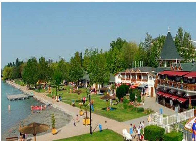
チョパクのビーチ

チョパクのビーチはとてもきれいですから、この地域でも特に人々のお気に入りビーチです。遊び場や低水位があるので、ビーチは子供向きです。ビーチの隣でキャンプ場もあります。バラトン湖畔では釣りが人気があります。釣りに行くときはビーチの東部でチケットを買わなければいけません。夏に色々な祭りやイベントがたくさんあります。6月から8月までエアシネマもあります。 ( http://www.kertmozi.hu/ )