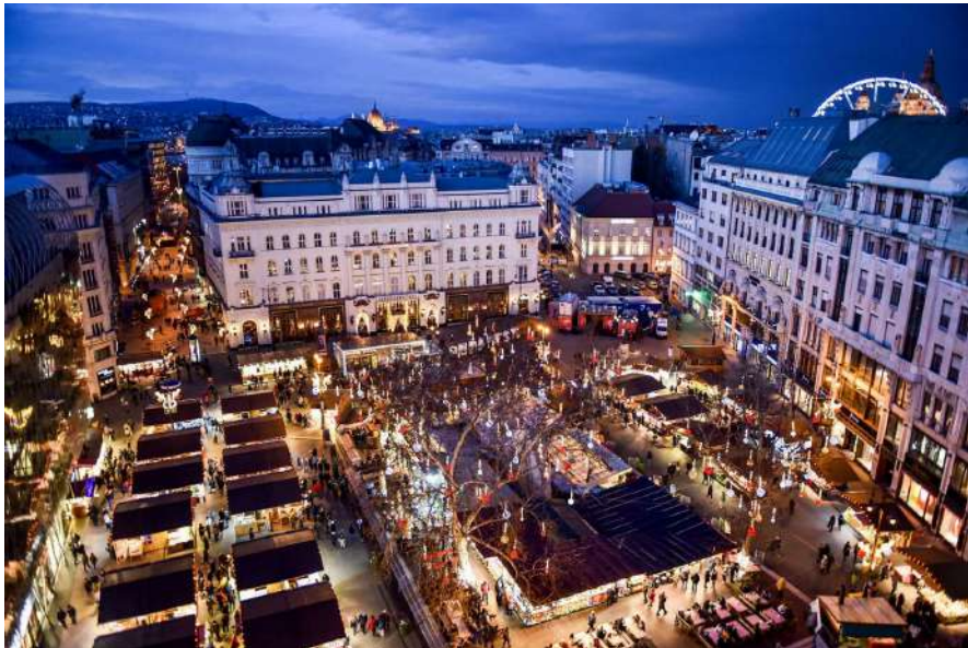
クリスマスマーケット