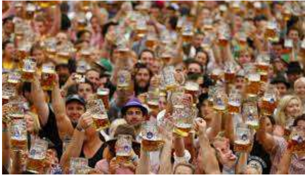
ビールフェスティバル

8月になると、世界中から約40万人がシギトフェスティバルに集まり、音楽の一週間の祭典を祝うためにやってきます。このフェスティバル以外にもクリスマスマーケット、ビールフェスティバル、ダンスフェスティバルがあります。フェスティバルはハンガリアの創造力を祝うために開催されています。