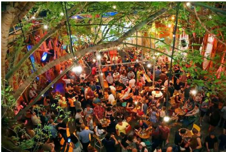
📍 Instant-Fogas Complex