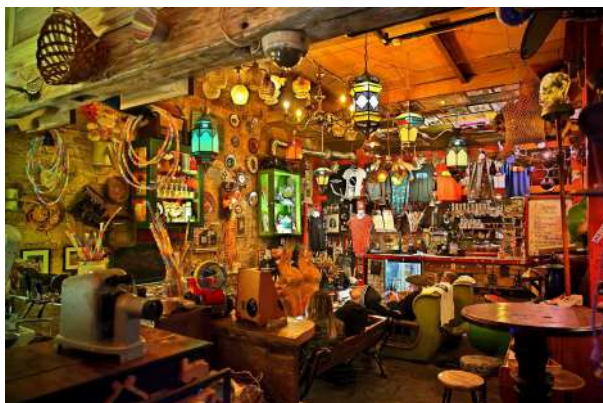
地図: 📍 Ruin Bars Budapest