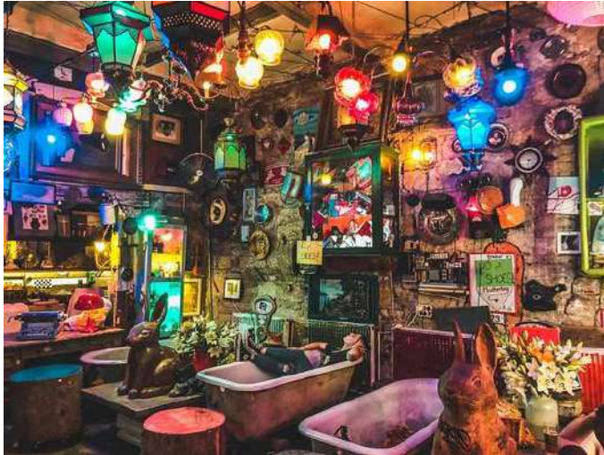
📍 Szimpla Kert

数年前、若者たちが崩れかけたアパートメントで可能性を見つけ、それらを雰囲気豊かで有名なバーに変えることに成功しました。これらのバーはブダペストのナイトライフに新しい息吹をもたらし、観光客に人気のある訪れる場所となりました。これらのバーの中から、最高のものを挙げます。