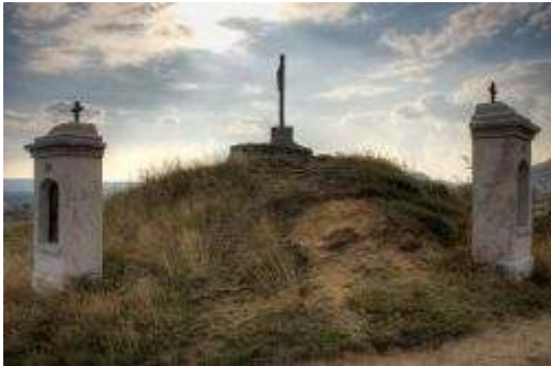
ブダオルシュのカールバーリア