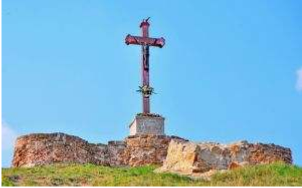
丘の上にある十字架