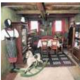
リエデル・フェレンツ博物館