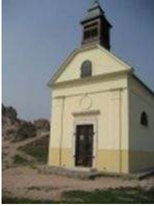
コーヘジ (石山) 上の チャペル