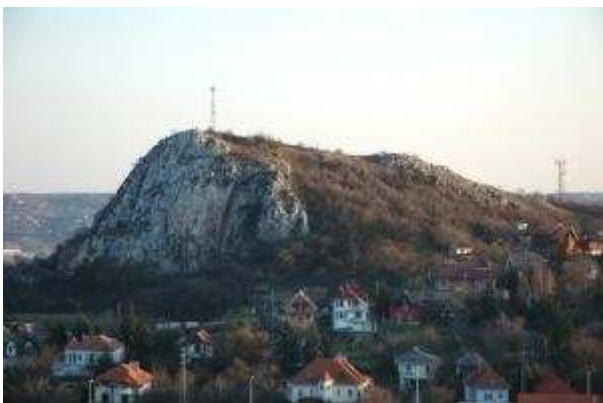
トルコウグラトー

ブダ山地の一部がこう（トルコ人が飛び込む崖）呼ばれている。伝説によるとハンガリー人の兵士がトルコ人からブダを奪還したとき、トルコ人が馬に乗って、この山の上に逃げたが結局崖から飛び降りたらしい。