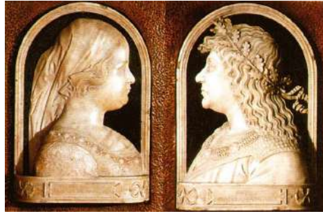
妻ビアトリクスとマティアス王