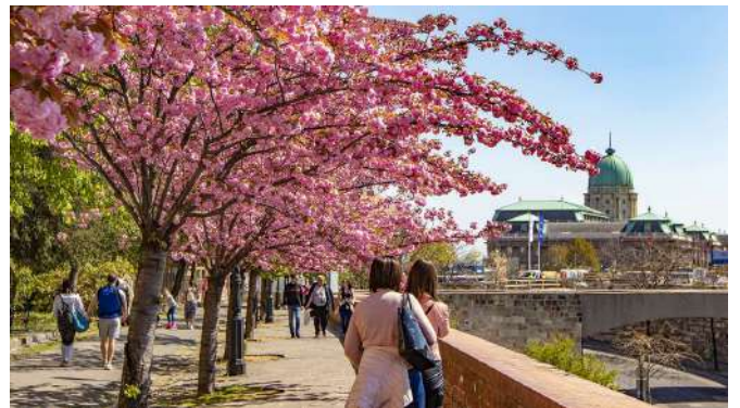
春のトート・アルパード散歩道