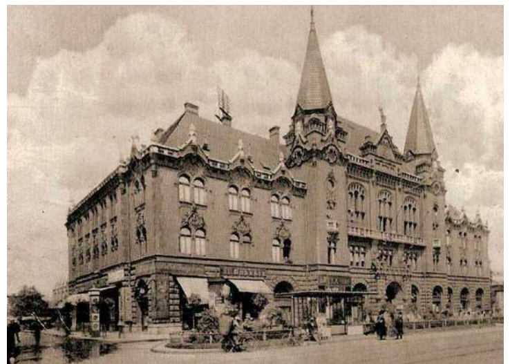
(ブダペスト4区の町役場)

ブダペストの4区は1830年にできました。19世紀末に4区は、工業が非常に発達しました。1950年にブダペスト市に併合されました。第二次世界大戦でたくさんの建物が破壊されて、この時、町で大水の被害もありました。また、1956年には革命がありました。1970年に町は再建されました。この時期には地下鉄も建設されました。そして存在の4区の姿がつけられました。