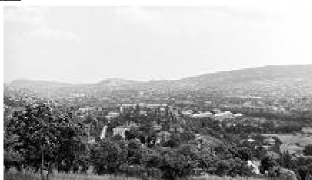
昔のシュワーズ山