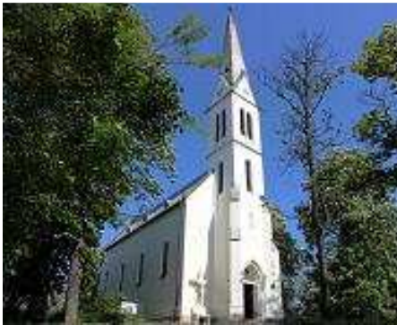
聖ラースロー教会