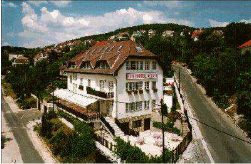
Rác Aladár út 45. 1121 Budapest; +36 1 249-0275