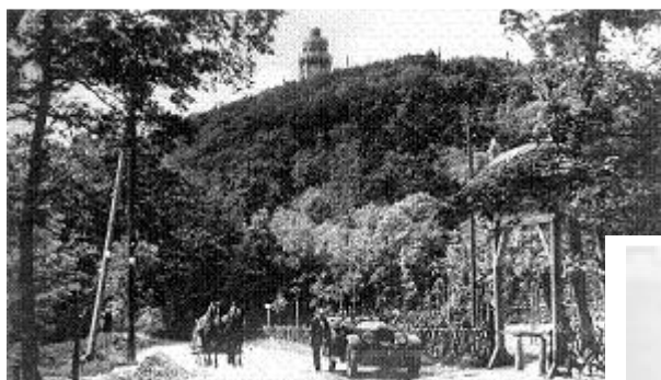
ヤーノシュ山の望楼

1858年に区で初めての学校がつくられました。19世紀の終わりになると、多くの歩くことが大好きな人やスポーツマンもここにやってくるようになりました。ヘジュウイデークの山には段々家が多くなってきていますが、それでもこの区はブダペストで一番緑の多い区です。