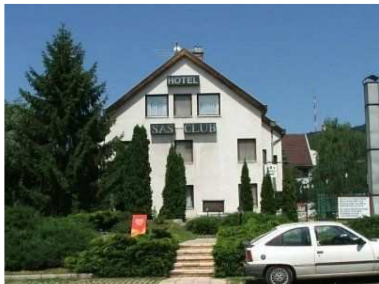
Törökbálinti út 51-53. 1121 Budapest; +36 1 246-6512