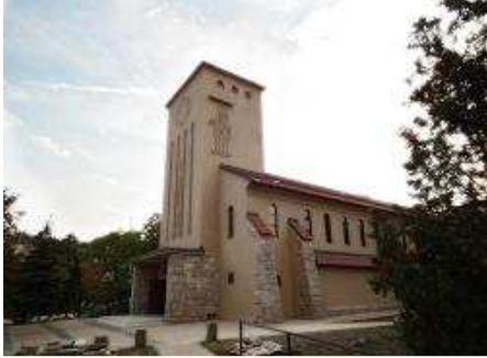
聖ヤーノシュ教会