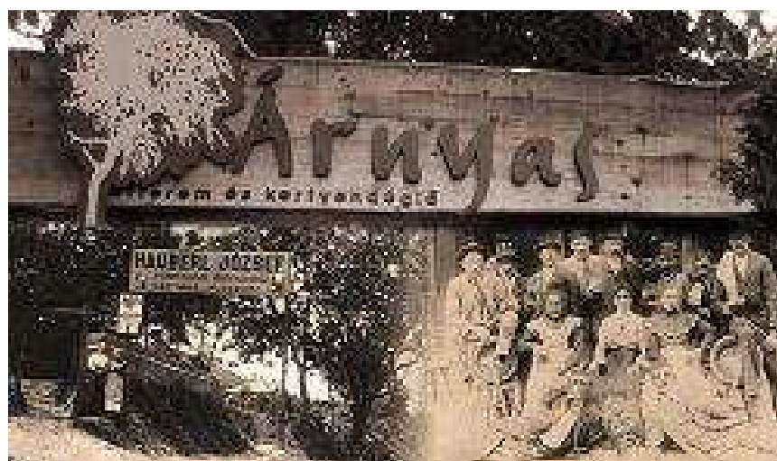
Budapest XII. Diós árok 16.

アルニャシュレストランは時間が止まっているようです。この不思議な場所で美味しい家庭料理を食べながら、中の壁にある色々な古いものを見て、古い時代について考えられます。外では100前に増えられたヨーロッパ栗の下で食事をすることができます。行き方は61番のトラムで Szent János 病院まで行って、128番のバスで Rózse-köz で降りるとすぐです。